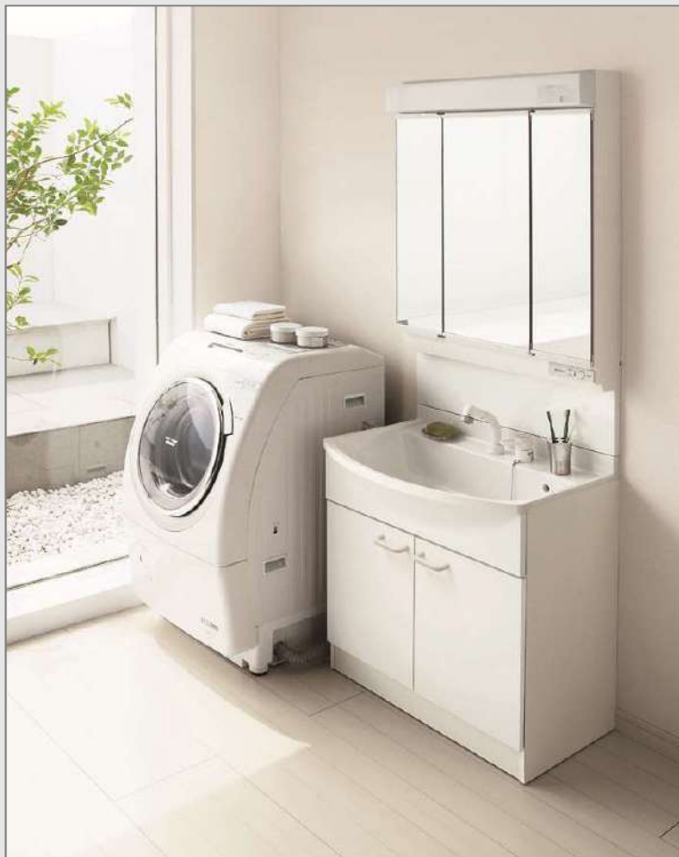
※写真の間口はW750です。