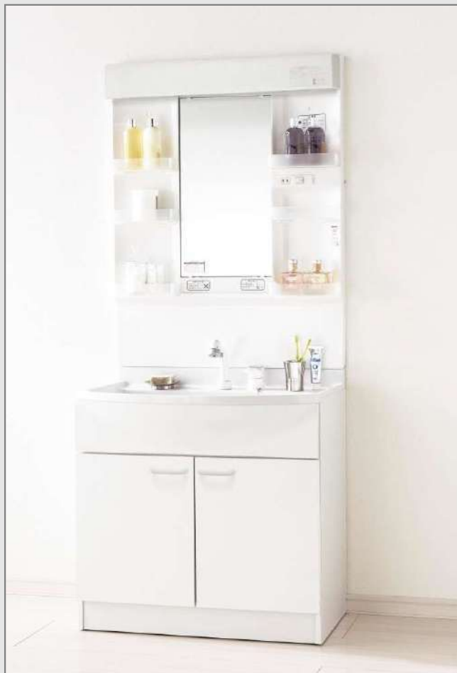
※写真の間口はW750です。