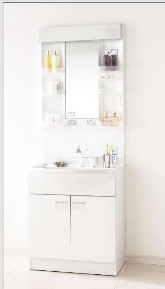
※写真の間口はW600です。